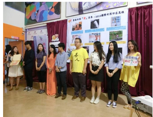
【10.08 勇敢女孩『讚』出來：2016 國際女孩日在高雄】