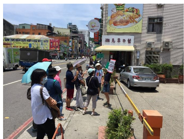
【05.07 女權會 X 性平協會 聯合會員活動 II】