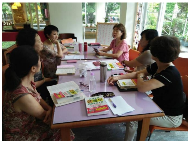
【105 年上半年度社區讀書會】