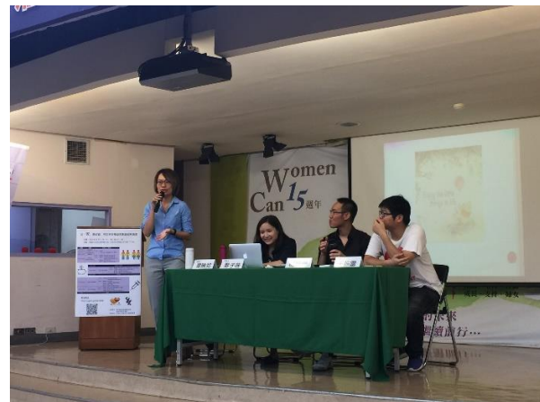
【09.11 成「家」路迢迢：同志伴侶權益與家庭政策論壇】