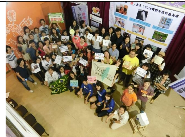
【10.08 勇敢女孩『讚』出來：2016 國際女孩日在高雄】