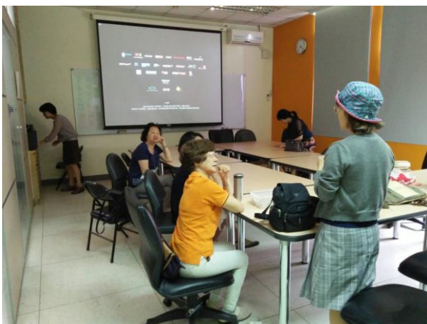
【105 下半年度社區讀書會】