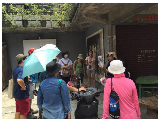
【05.07 女權會 X 性平協會 聯合會員活動 I】