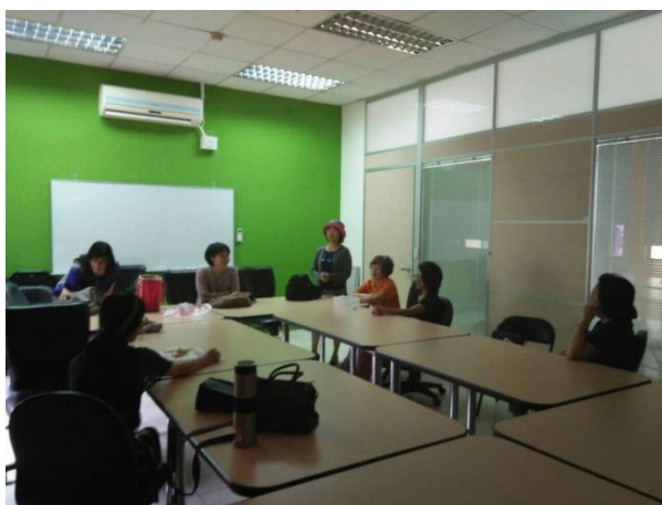
【105 下半年度社區讀書會】