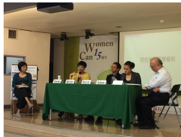
【09.11 成「家」路迢迢：同志伴侶權益與家庭政策論壇】