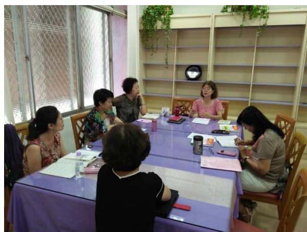
【105 年上半年度社區讀書會】