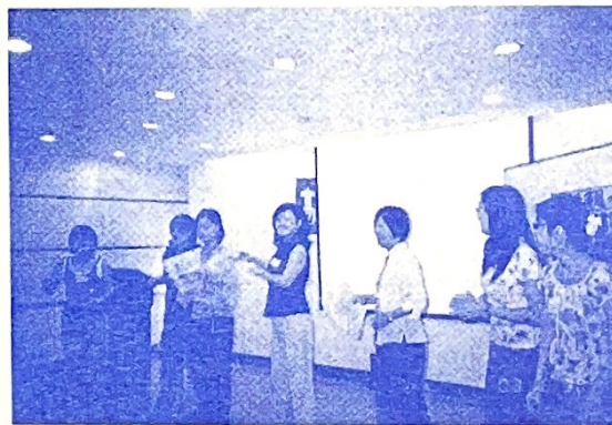
~講師們隨著音樂帶領大家熱歌勁舞~

「影中對話、小組時間」共欣賞了月經經驗相關影片「天使詩篇」、「兒時的點點滴滴」與親密關係影片「哈拉辣美眉」的其中橋段；影片寫實的刻劃了青少女們在青春期中會面臨到與身體有關的各種場景，包括初潮時的尷尬、兩性對性愛的探索等；青少女們在看影片時相當投入，隨著劇情起伏而驚嘆，都表示很想把影片完整看完呢！