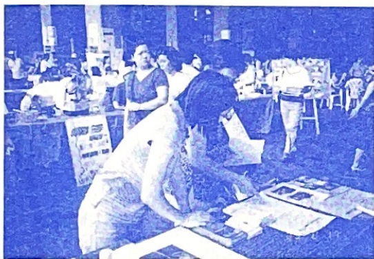
~民眾詢問課程相關資訊~

新興社區大學新學期又開課了，這次高雄市女性權益促進會分別設計了兩門課程：「中老年婦女健康自覺團體」、「母職成長團體」；當天許多婦女朋友們均詳細的問了課程的內容，攤位上也放置了女權會的DM、活動訊息、團體課程等相關資料，讓高雄市的市民們更了解女權會。