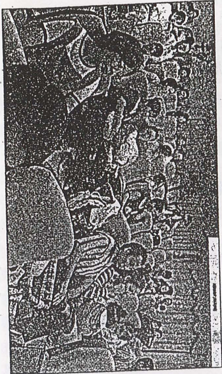
許多外籍新娘抱著小良比，在先生的陪伴下出席「外籍新娘座談會」。

隨著兩岸通婚與外籍新娘日增加，加上下一代的出現，外籍新娘衍生的問題愈來愈受到關注：昨日在高雄市府文館舉行的首次舉辦的「外籍新娘座談會」就有數十對外籍新娘，在先生的陪伴下，抱著娃兒出席座談會，場面熱鬧。 由高雄市婦女權益促進委員會承辦的該項活動，透過座談會及身體健康檢查第一次在高雄舉辦，許多外籍新娘也頗獲啟發，交談熱絡，先生之間也有說不完的話，小孩子們也無不歡天喜地，參與活動的外籍新娘都好好把握機會，對於自身的權益問題發言踴躍。 高雄市婦女權益促進會秘書長唐文慈指出，高雄市合法的外籍新娘就有一千多人，大多居住在高雄市旗津區、前鎮區、鼓山區，其中大陸新娘佔半數，其他有越南、印尼新娘，特別是柬埔寨新娘最近增加許多。 昨日外籍新娘最關心的是如何取得工作權及取得一張中華民國國民的身分證。沒有身分證，工作難找，許多自身的權益也因這聽差說造成不少困擾。其中菲律賓的新娘因為大多只會說英語，造成社交上的困難。 大陸新娘則抱怨：因為政府的政策，大陸新娘想取得中華民國國民的身分證要來台居住七、八年才取得（菲律賓新娘需要五年）許多娶大陸女子的台灣先生，因為收入較少，很需要大陸新娘能外出工作，補貼家計，生活壓力對家庭生活造成不少影響，有的大陸新娘因為無法忍耐久等返回大陸，造成婚姻破裂；大陸新娘雖然較少語言障礙問題，但婆媳問題比起菲律賓、越南等外籍新娘，卻更加嚴重。