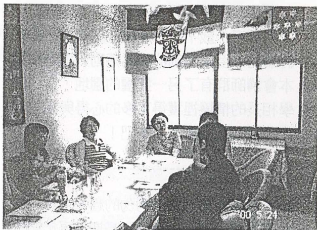
圖說：志仁老師與社區讀書會成員

從讀書會的分享模式，讓我體驗到很多事情，就如看書一般；不同角度、不一樣的人就有不同的解讀。如果我們能再遇到不如意的事情時，學習『放下』，轉換立場或角度，再重新思考，你便能豁然開朗，讓自己隨時隨地都能活在快樂的學習當中。